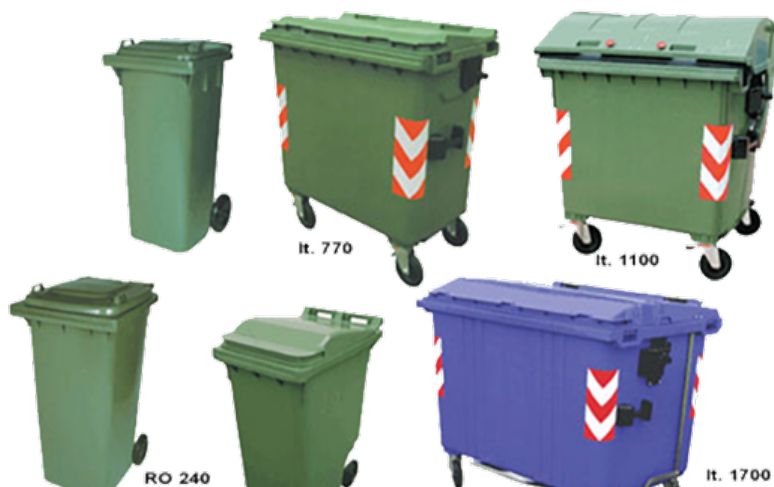
Figura 2 – Tipologie di cassonetti

◆ cassonetti a quattro ruote con capienza da 660 a 1.700 litri movimentati da due addetti come previsto dal CCNL