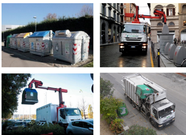
Figura 1 – Raccolta automatica, alcuni momenti

L'azienda incaricata del servizio di raccolta rifiuti provvede al mantenimento, alla pulizia e decoro dei bidoncini e dei cassonetti, sostituendo con regolarità quelli usurati o danneggiati.