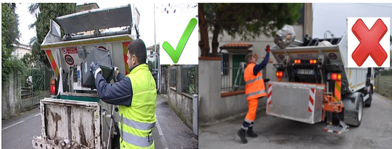
Figura 4 – Raccolta manuale, alcuni momenti