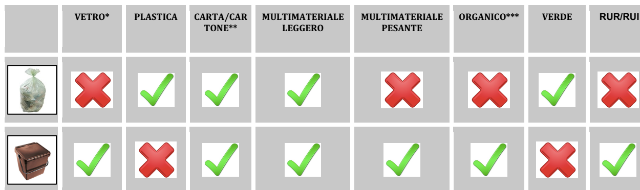
Tabella 2 – Utilizzo di sacchi e mastelli per tipologia di rifiuti

* per il vetro la soluzione di campate stradali è ottimale, anche in presenza di sistemi di porta a porta spinti (si veda nota 1 a pag. 16)